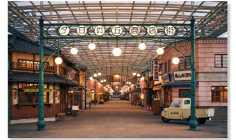
M & © TOHO CO., LTD. ©TEZUKA PRODUCTIONS

2021年春にリニューアル！昭和の熱気あふれる体験、アトラクションが盛りだくさんです。1日レジャーチケットを補助付きの特別価格にて斡旋します。